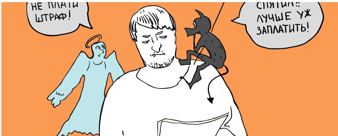
Иллюстрация: Люба Крутенко для ОВД-Инфо