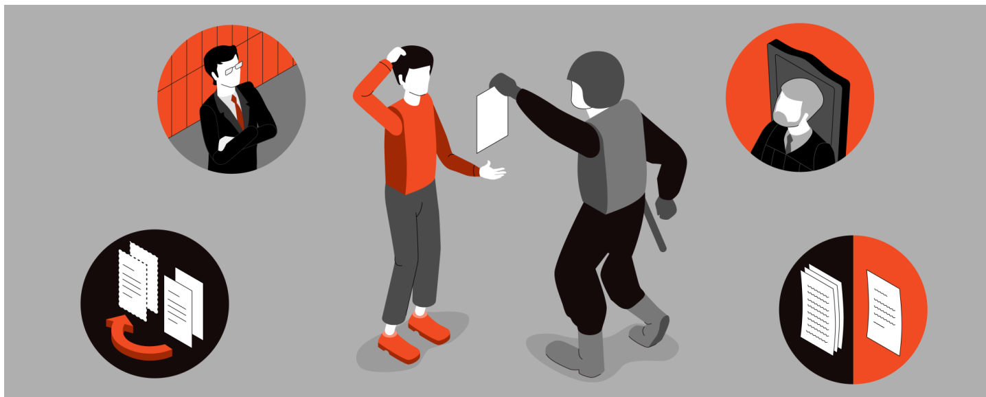
Иллюстрация: Анна Семькина для ОВД-Инфо