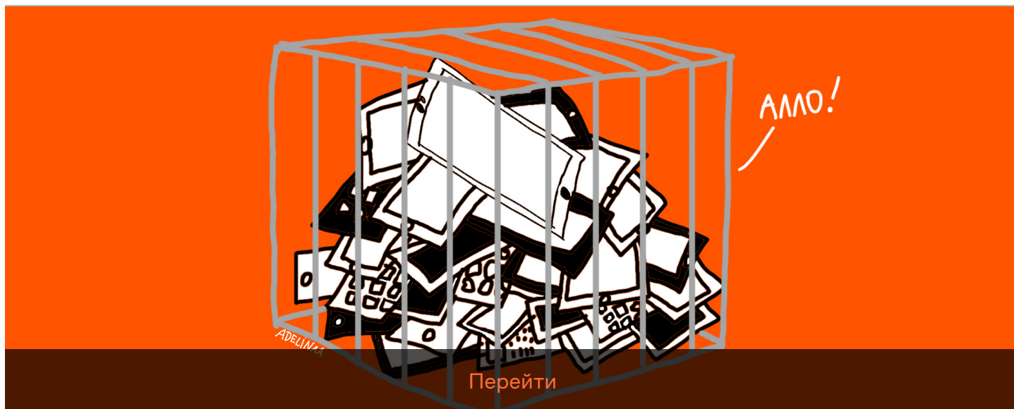
Иллюстрация: ADELINAA для ОВД-Инфо