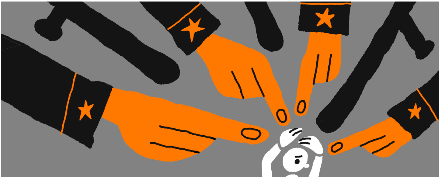
Иллюстрация: Мария Афолина для ОВД-Инфо