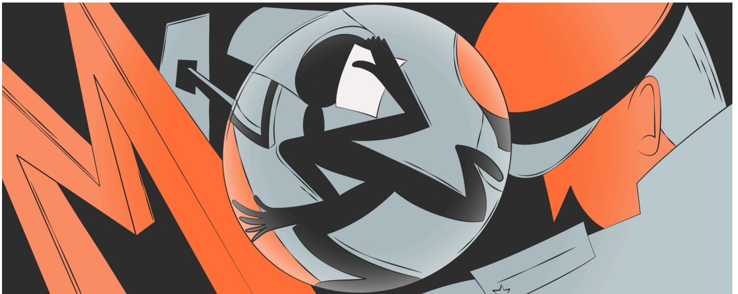
Иллюстрация: Екатерина Симачева для ОВД-Инфо